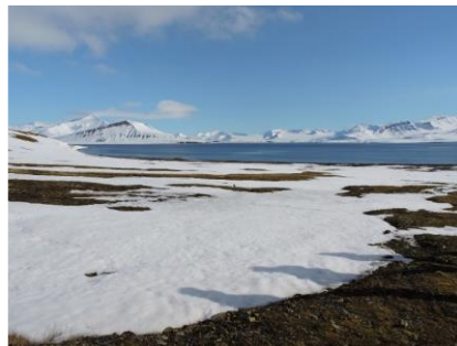
バレンツブルグの観測地