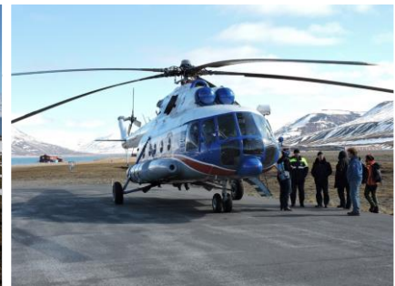
バレンツブルグ観測地へ向かう ヘリコプター