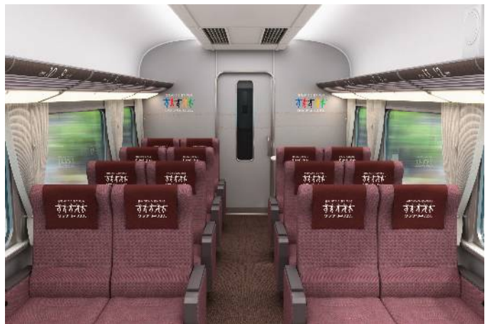
クラブツーリズム専用列車イメージパース(車内)