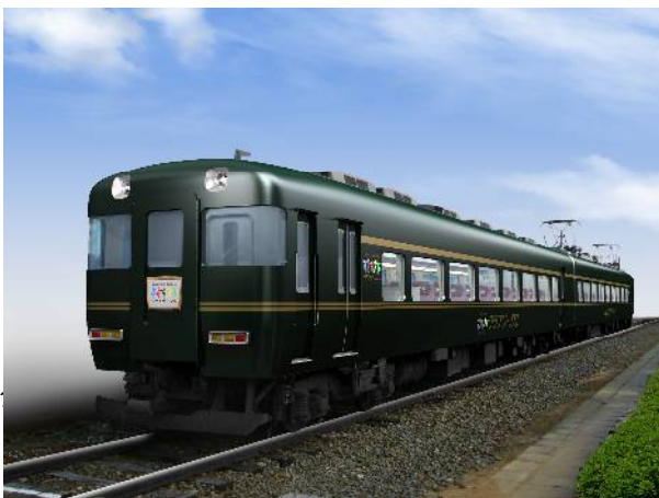
クラブツーリズム専用列車イメージパース(外観)