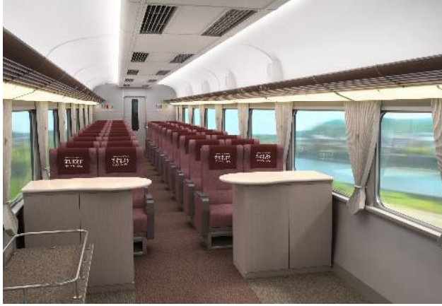
クラブツーリズム専用列車 イメージパス(車内)