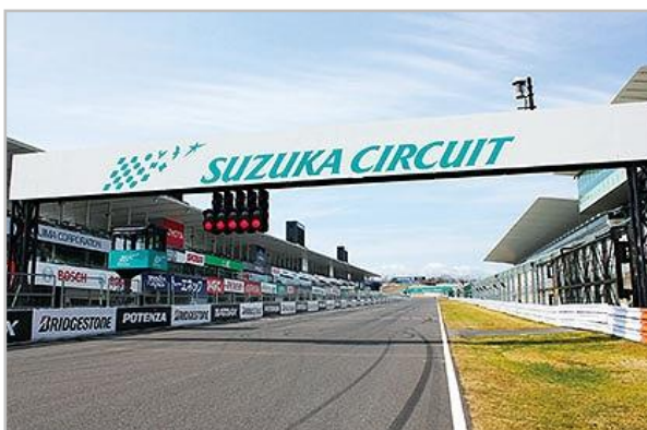
鈴鹿サーキットのメインストレート(イメージ)

新たな年の幕開けの時に、国際的なモータースポーツの舞台での“あるき初め”を是非お楽しみください。