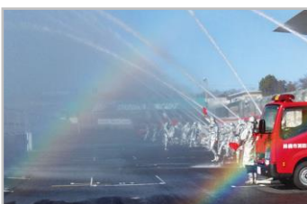
鈴鹿市消防出初式の一斉放水(都合により内容が変更になる場合があります)

※「鈴鹿サーキット ウォーキングイベント」へは、 クラブツーリズムのツアーでのご参加に限らせていただきます。 ツアーの詳細はホームページをご覧ください。 http://www.club-t.com/special/theme/suzuka-walk/ (検索 ⇒ クラブツーリズム 鈴鹿サーキット)