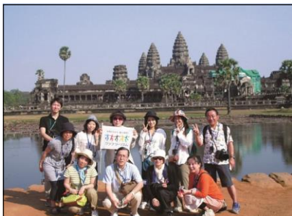
「海外ひとり旅」 世界遺産 アンコールワットにて

http://www.club-tourism.co.jp/press/2014/0206.pdf