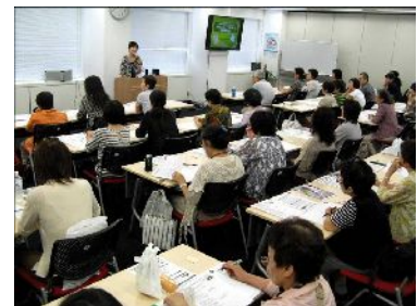
講師への質問や、講座参加者同士の交流も活発です

クラブツーリズムは、60代以上が3分の2を占める顧客層を背景に、「旅行を通じてクラブツーリズムと出会い共に歩み続けているお客様に、旅行以外の場面でも末永く寄り添い、人生の最期までお客様をサポートする企業でありたい…」という思いを実現するために、“自分らしい人生のエンディングを考えるお手伝い”をテーマとしたクラブツーリズムならではの講座提供に取り組んでいます。今年の4月からは、旅と旅の間の日常をもっと豊かに楽しく過ごせるためにクラブツーリズムが実施している「旅の文化カレッジ」内で、「エンディング準備講座」、「葬儀・お墓の最新事情と費用」、「やりたいことリスト作り講座」、「遺品整理のプロが語る今日から始める身辺整理」などの「終活」に関する講座や霊園巡りツアーを実施し、9月までの期間でのべ約1,000名の方が参加しています。