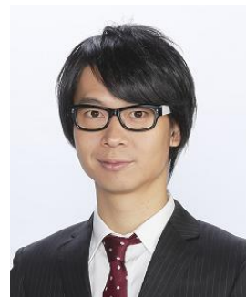
房野史典(ブロードキャスト!!) ナビゲートのオンライン講座 『超現代語訳 戦国時代』