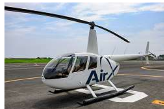
ヘリコプターで尾瀬を空中散歩