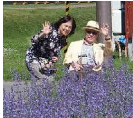
旅行を通じて、シニアがいきいきと 生活できる社会へ（イメージ）